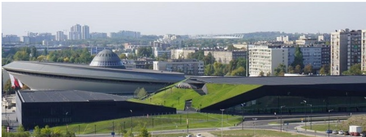
JEMS Architekci MCK Międzynarodowe Centrum Kongresowe Katowice